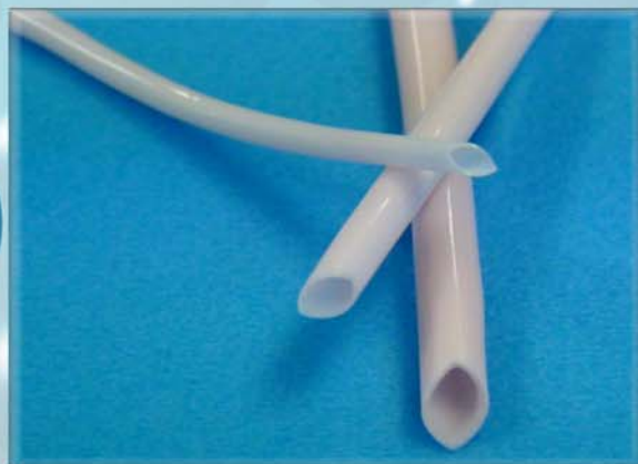
標準強度のGFSシリーズ 内径0.3から28mmまでラインナップ