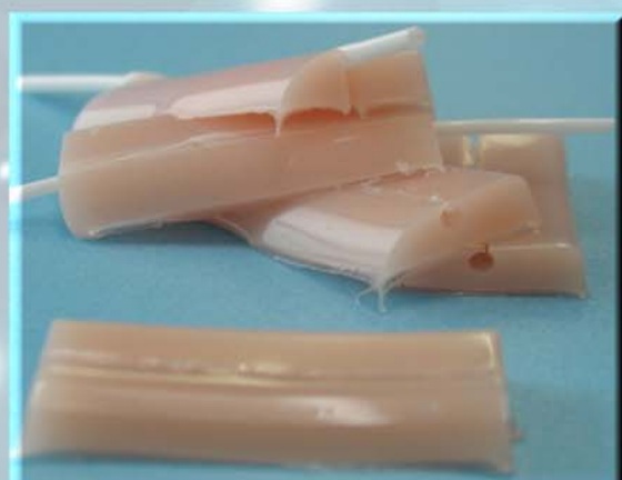
糸針の通りもリアルな筋肉モデル