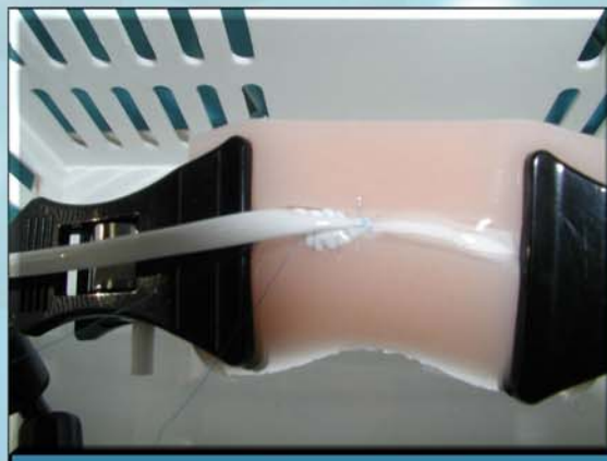
フィテングも良好