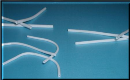
GFシリーズ 程良い厚みを持ちながら強度は弱め 内径1.2から2.7mmまでラインナップ