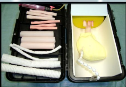
CVTトレーナー心臓 カニューレションから冠動脈吻合 大血管まで多彩な練習ができます。