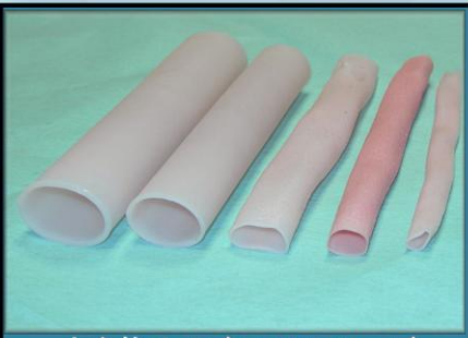
大血管サイズのDKシリーズ 内径 8mmから28mmまで