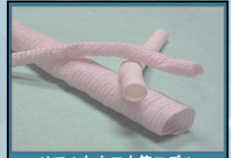
リアルな人工血管モデル 10mm 12mm 28mm