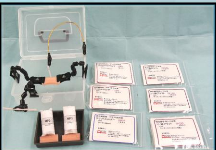
心外セット 1.5mmから2.7mmの血管が付属 模擬心筋に挟んでリアルな練習