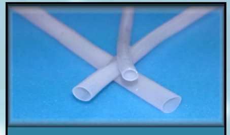
GFUシリーズ デリケートな吻合が必要な脆弱モデル 自信のある方は挑戦ください。