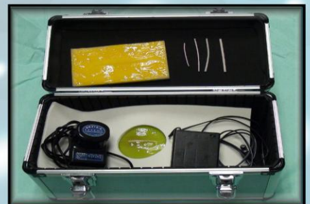
OPCABトレーナー 鼓動 拍動下でリアルな冠動脈吻合 レートも向きも変更可能です。